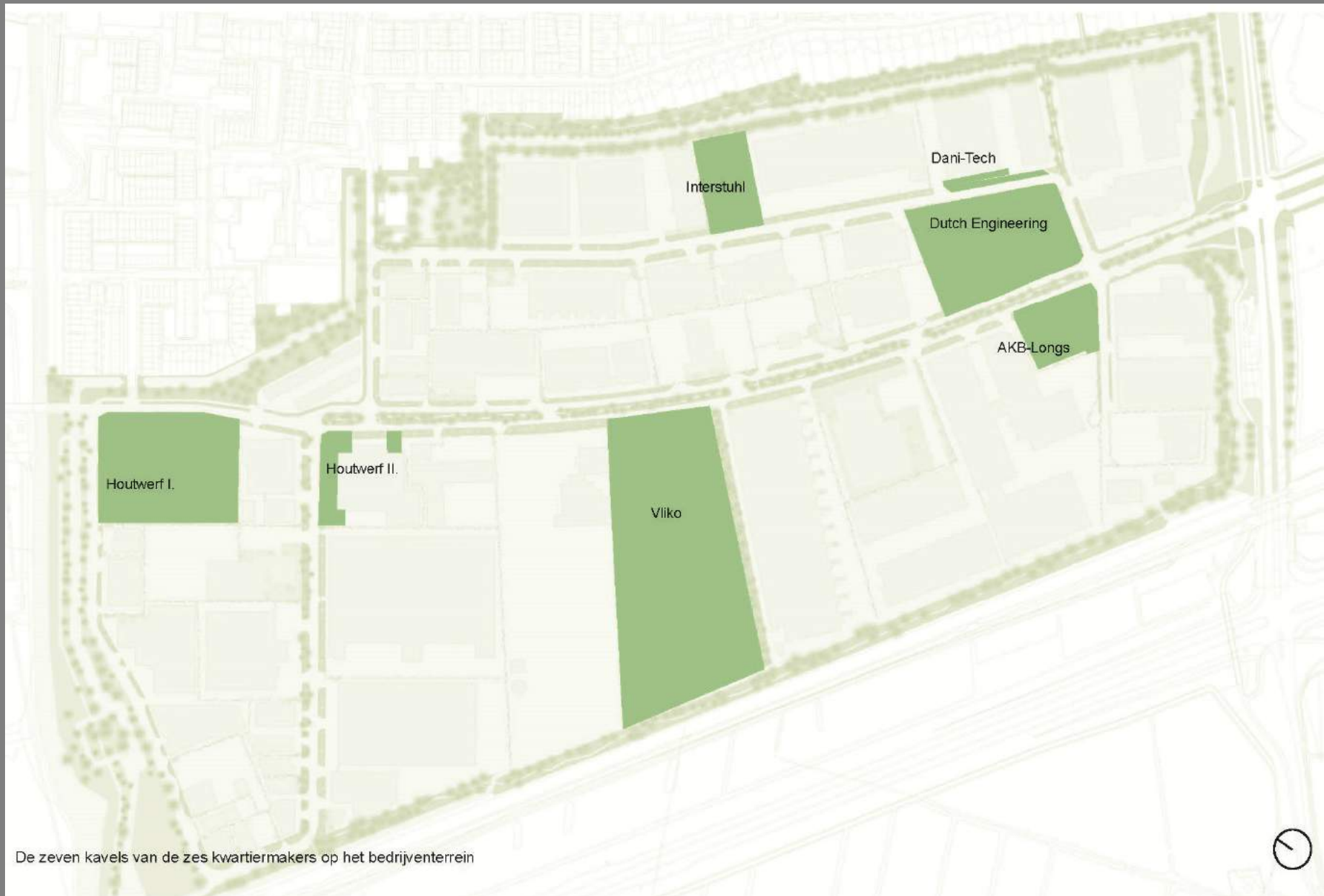
De zeven kavels van de zes kwartiermakers op het bedrijventerrein