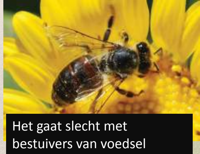
Het gaat slecht met bestuivers van voedsel