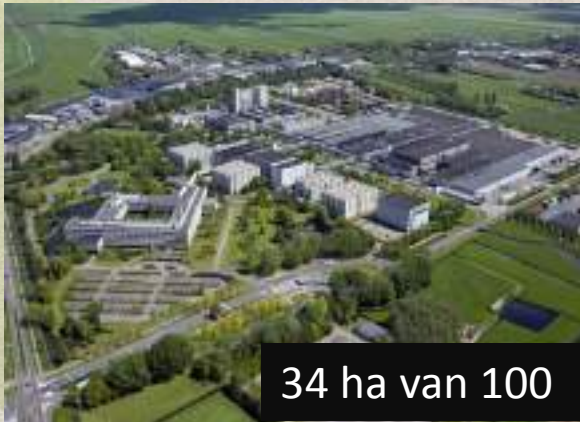
34 ha van 100